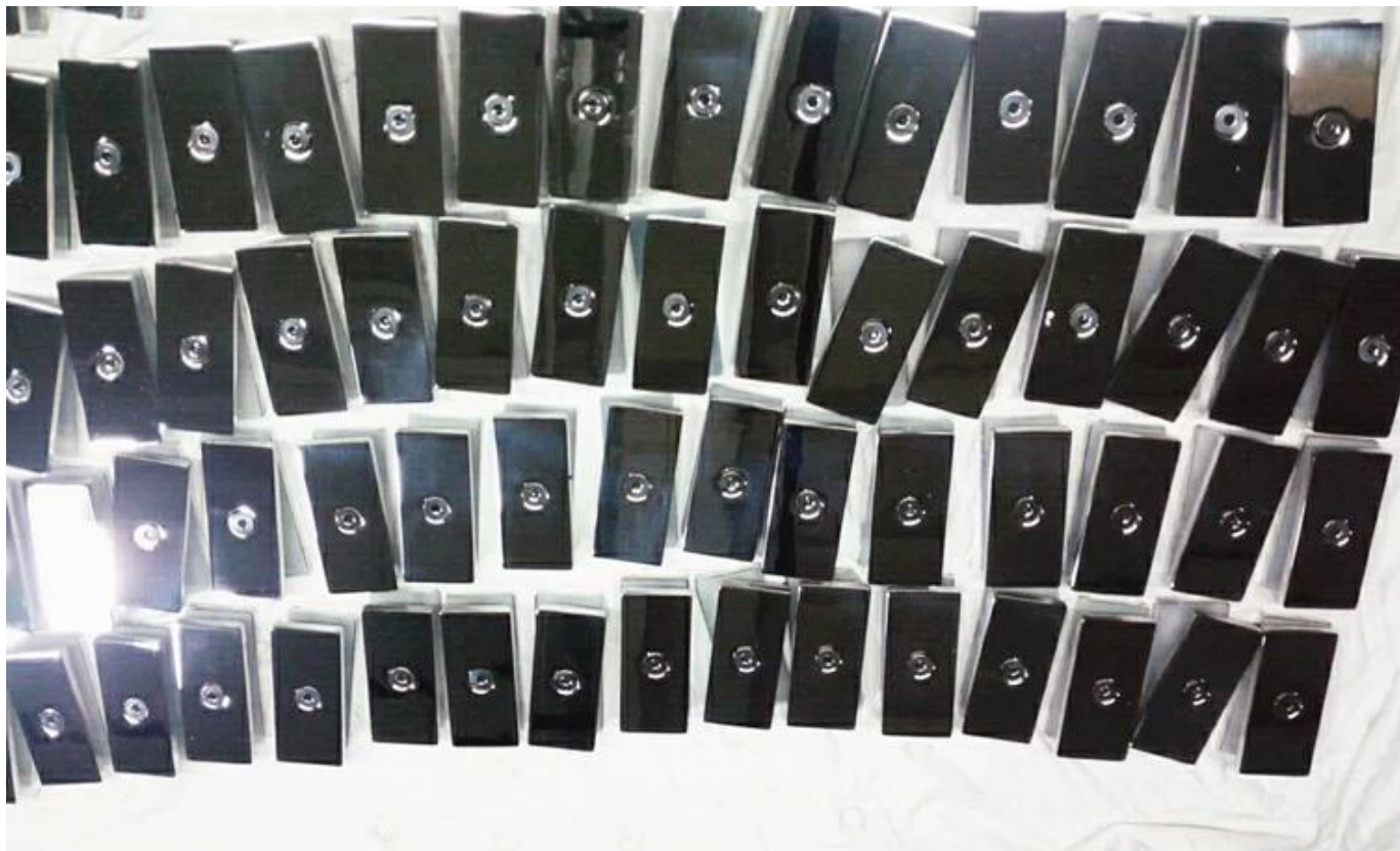
# 35 * BC-80 صور من جولة موصل الزجاج المشبك