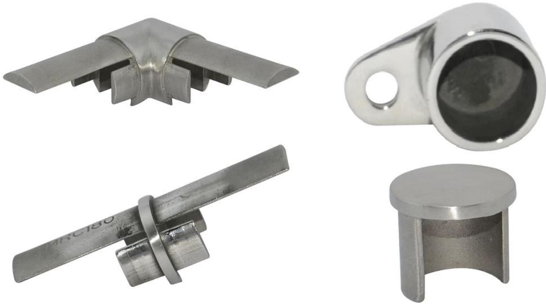
السكك الحديدية أعلى مربع