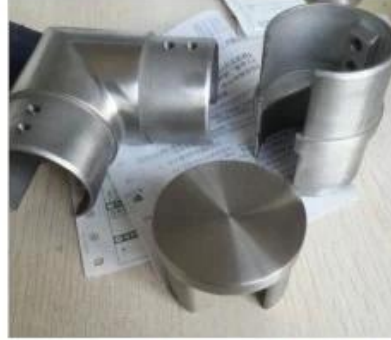
accessories for \phi 50.8mm tube