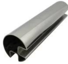
2 channel 90° handrail tube