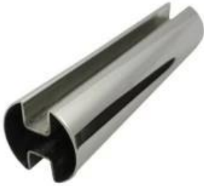
2 channel 180° handrail tube