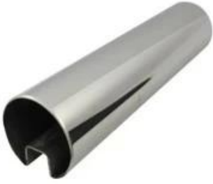
one channel handrail tube