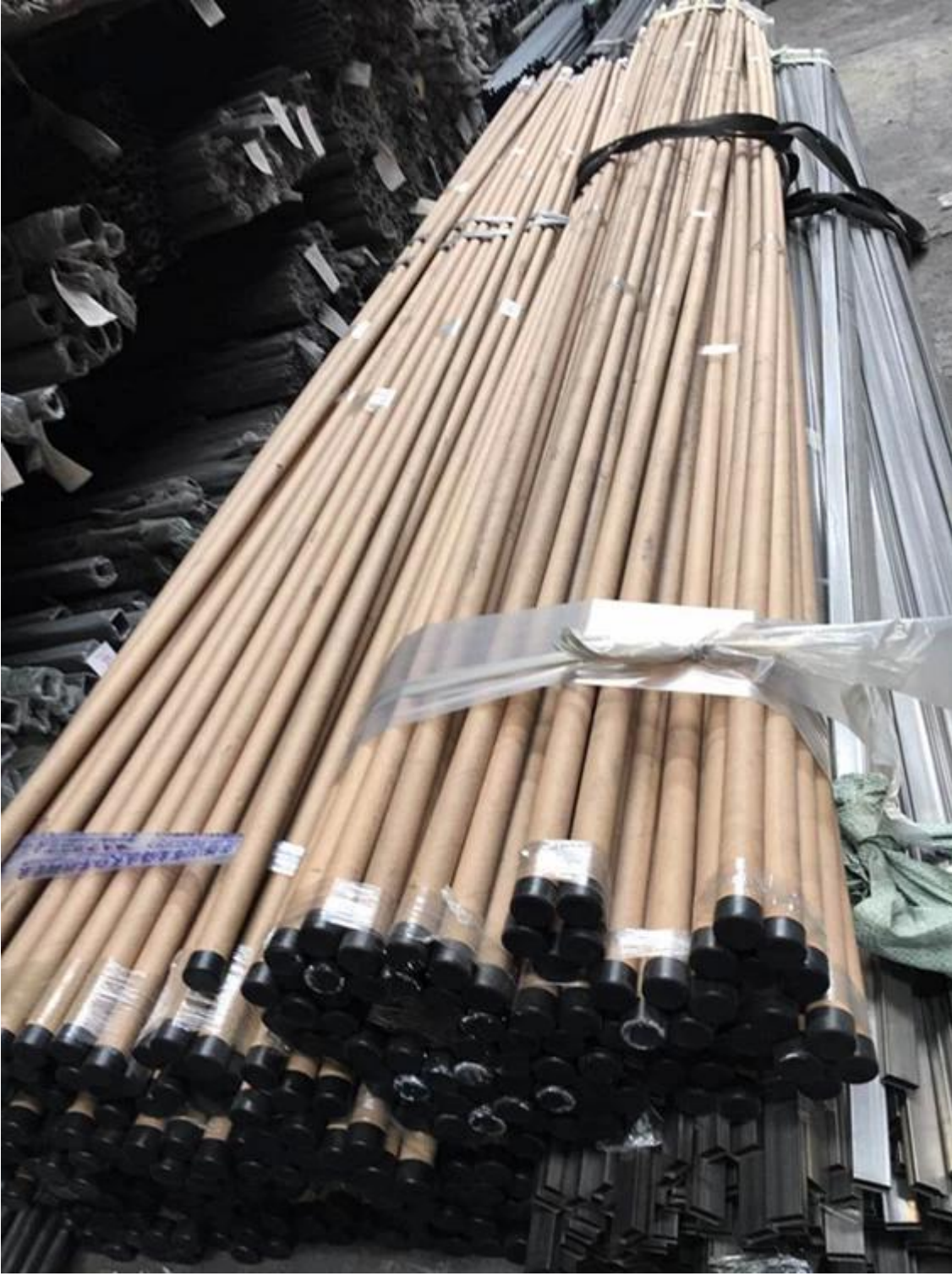
(الإطار المعدني (100 قطعة في إطار معدني واحد