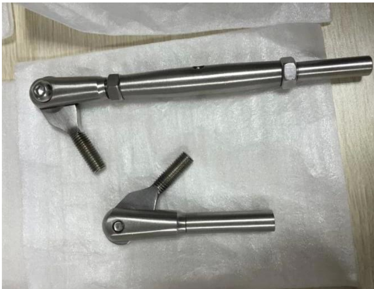
3 T807A - .