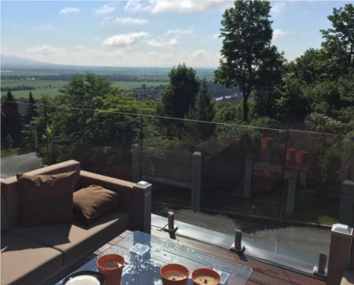
شنتشن إطلاق كو، المحدودة هي المهنية تصنيع مع تصميم والإنتاج والمبيعات من الفولاذ الصلب الأجهزة، الزجاج حديدي التجهيزات، الدرايزين الاكسسوارات وغيرها من المنتجات.