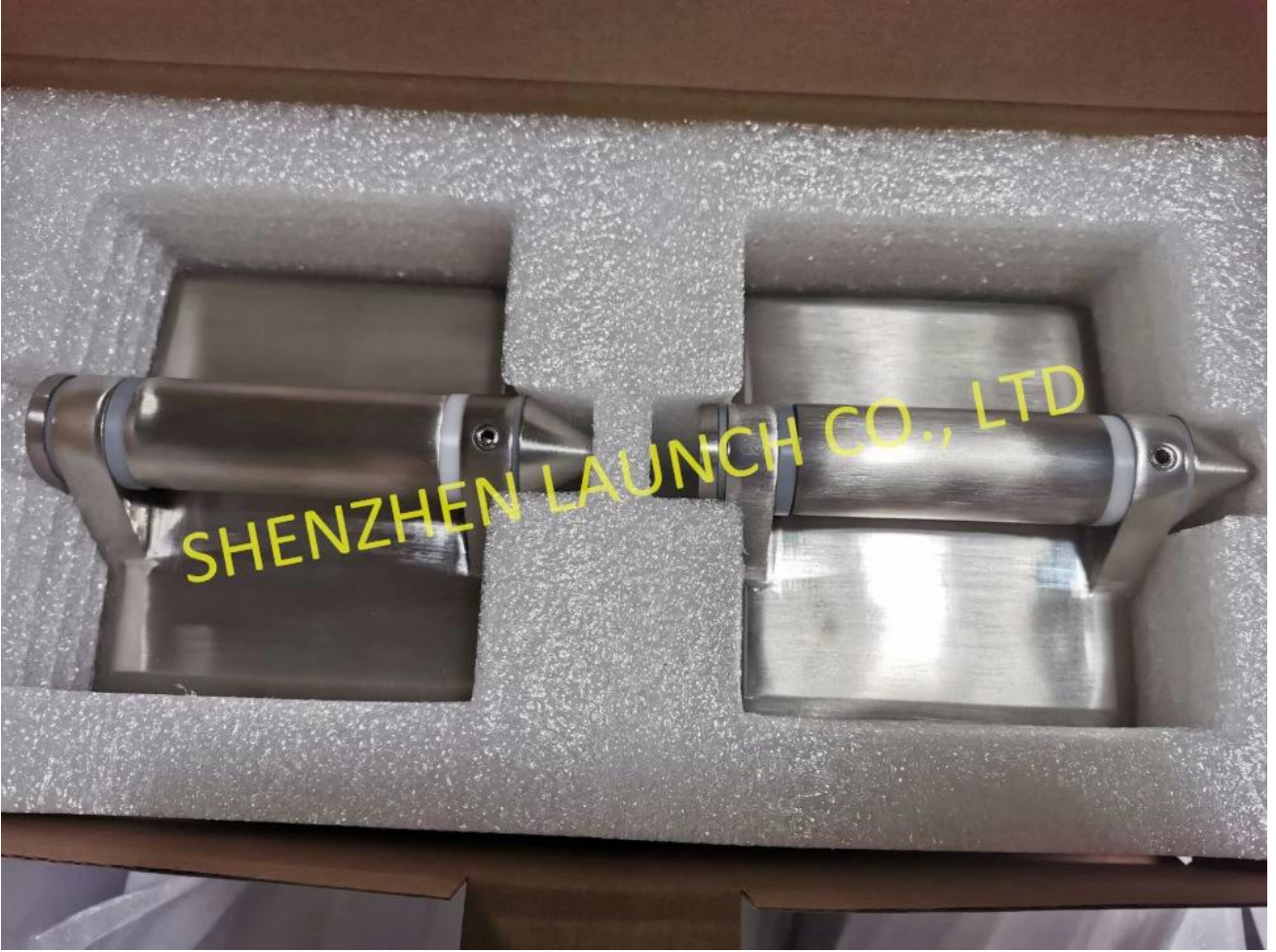
مفصل من الزجاج إلى الزجاج بعد المفصلة، مع غطاء مسطح على الأطراف