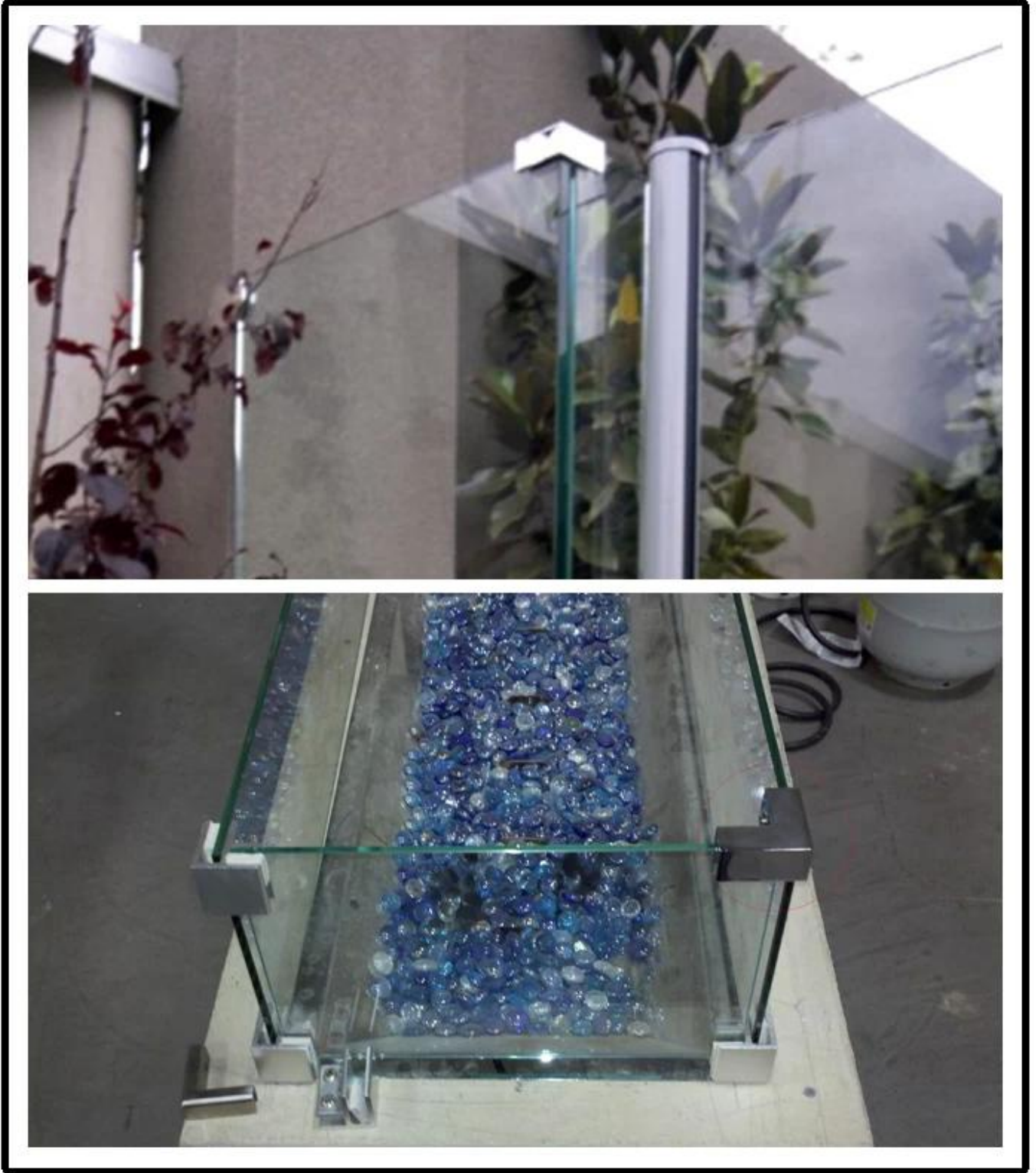
أنواع مختلفة من المشابك الزجاجية بأبعاد: