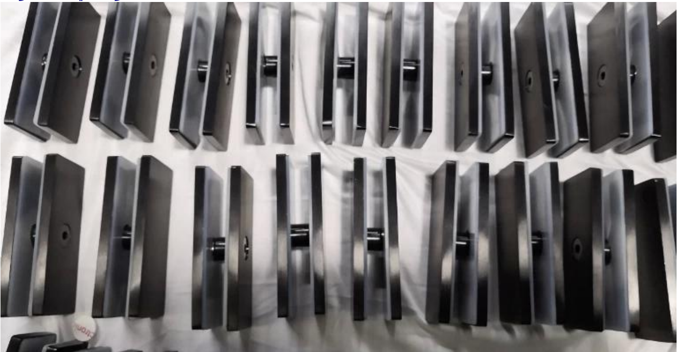
PV-90 مشبك زجاجي 90 درجة