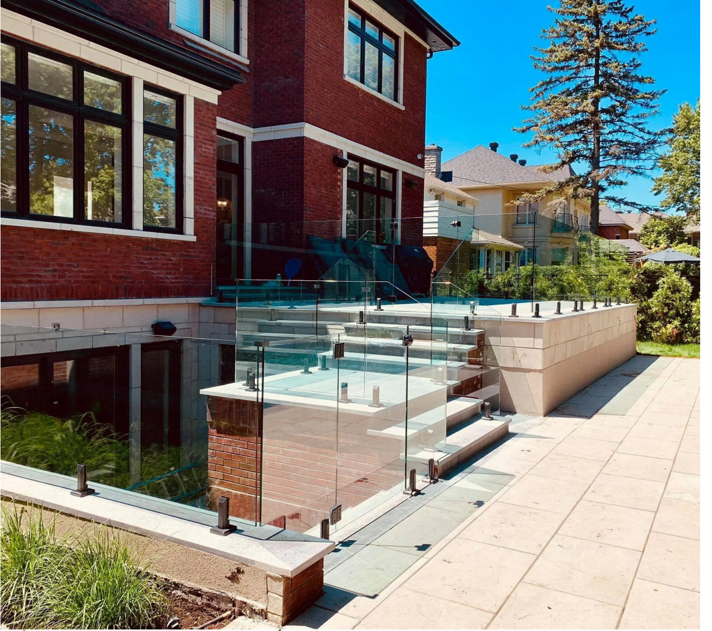
أنواع مختلفة من المشابك الزجاجية ذات الأبعاد