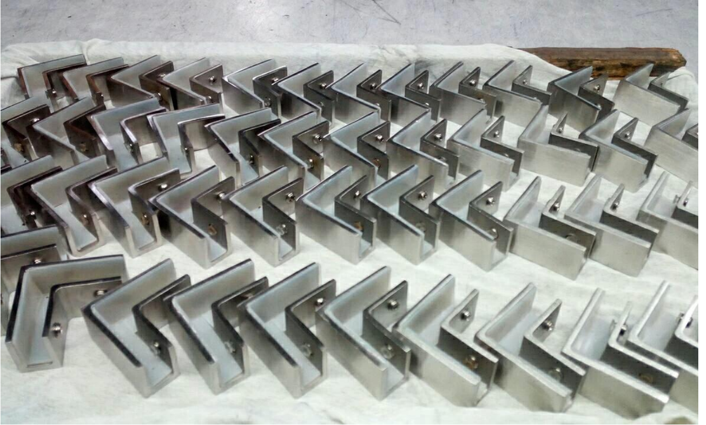
BC-8035 مشبك زجاجي 180 درجة