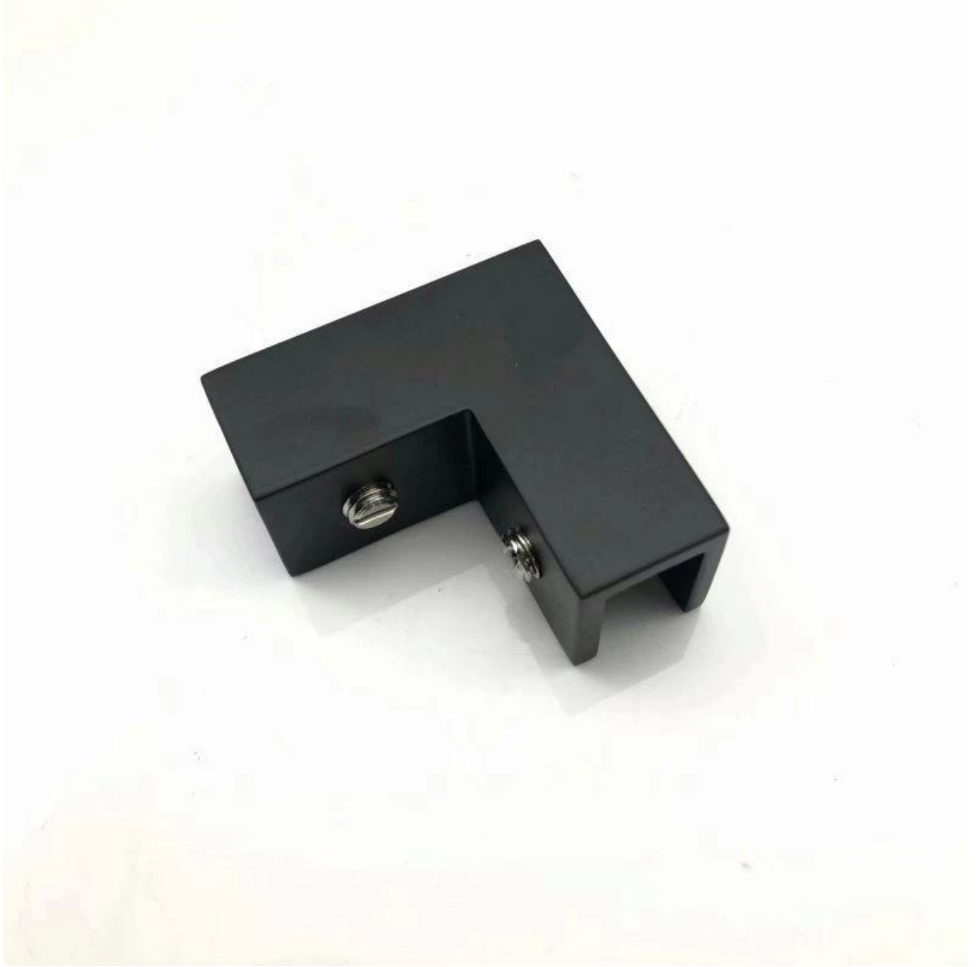
:مشبك زجاجي زاوية 90 درجة من الساتان والمرايا واللمسة النهائية السوداء