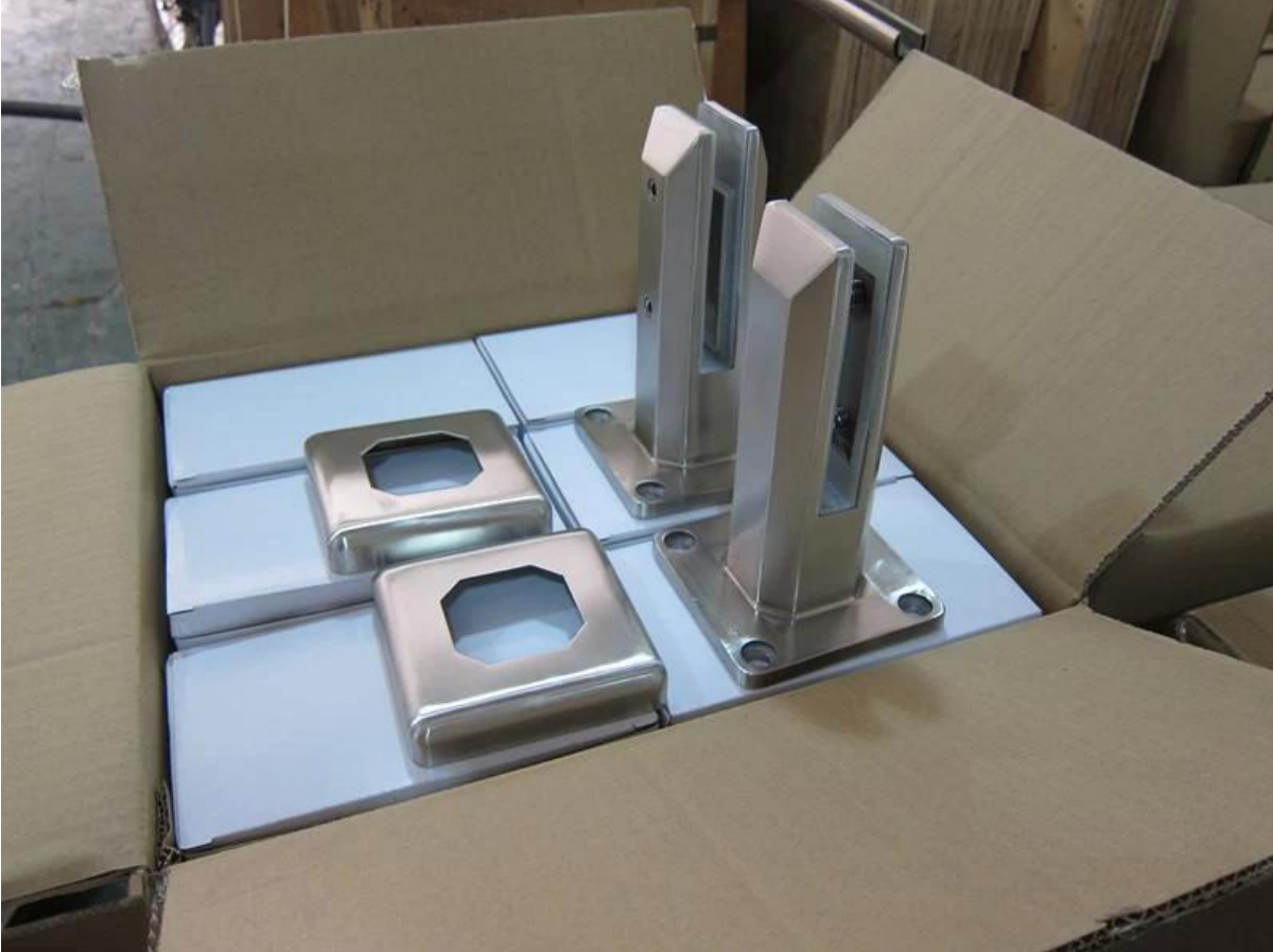
صور المشروع: في النهاية المرأة SBM: