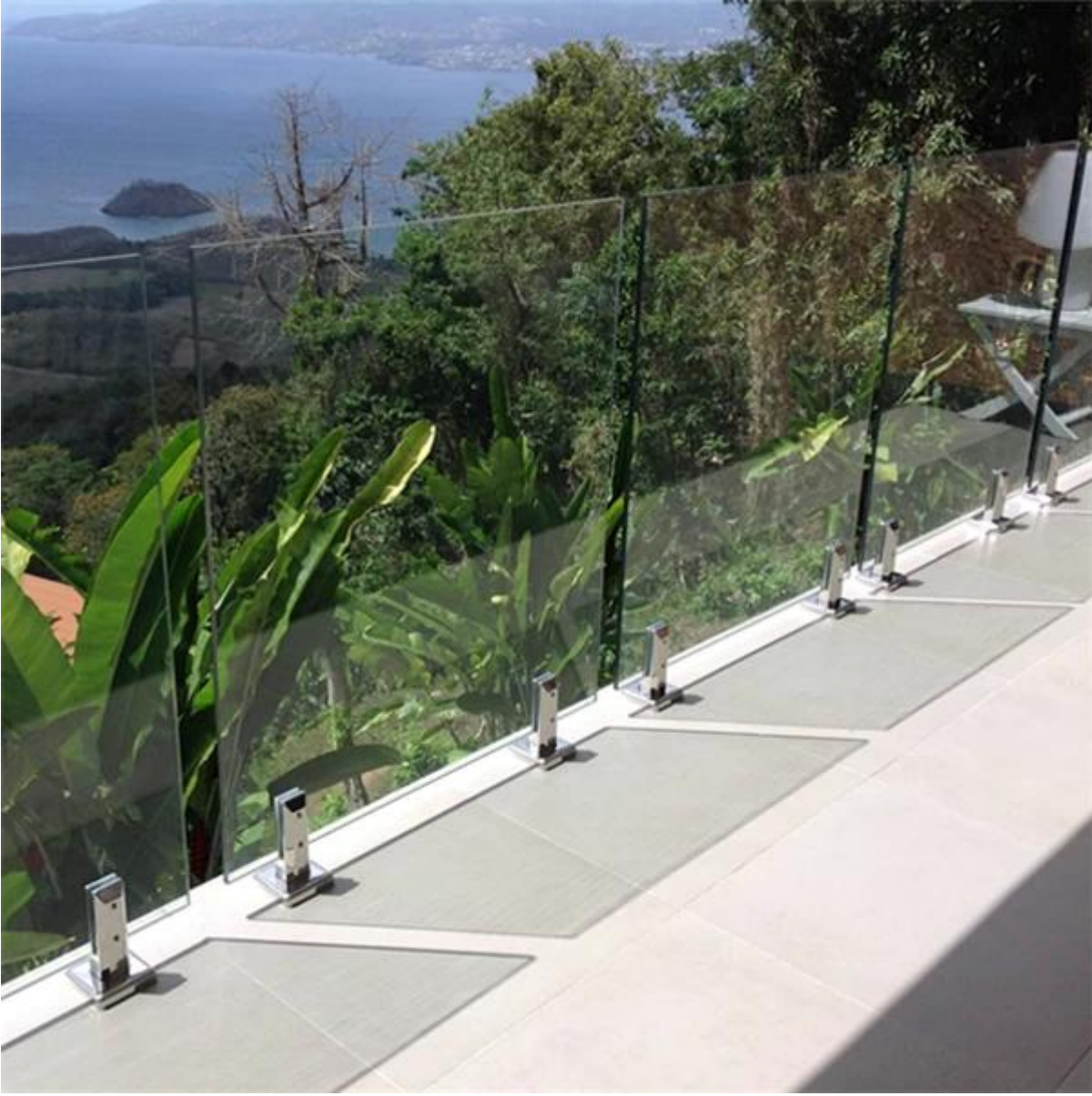
الزجاج جولة حنفيه المشابك لأمن حوض سباحة السياح