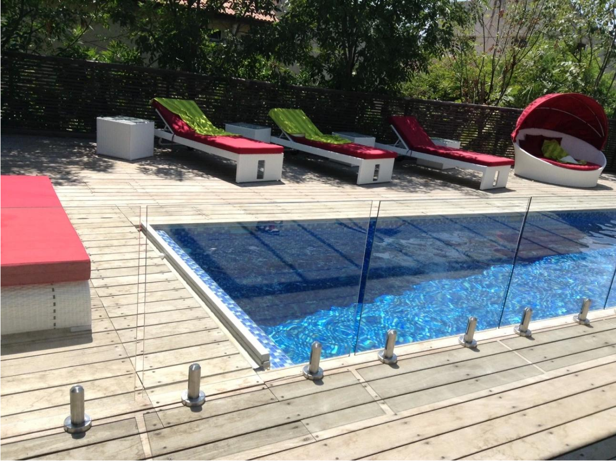
ساحة حنفية الفولاذ المقاوم للصدأ لتصميم الدرج