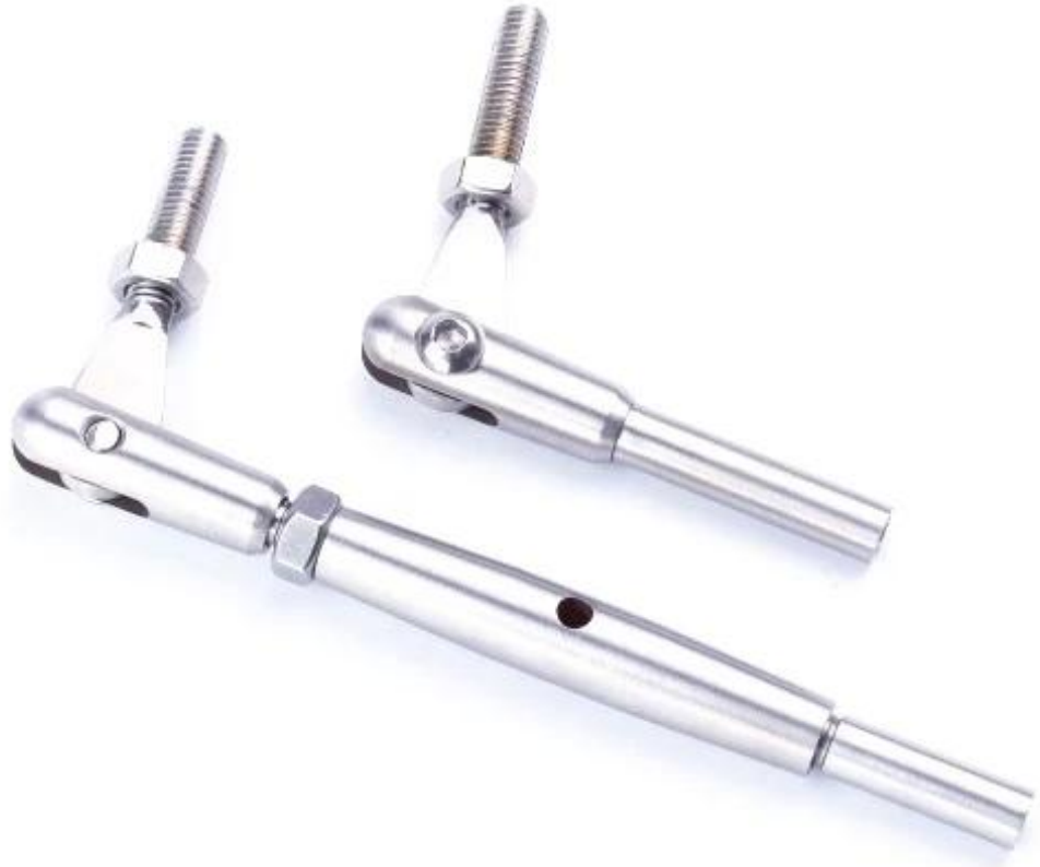
الفولاذ المقاوم للصدأ كابل سطح السفينة حديدي الصور 316 #