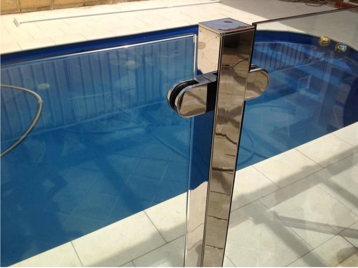
تحميل الجانب درايزين مربعا وظيفة الزجاج حديدي للداخل