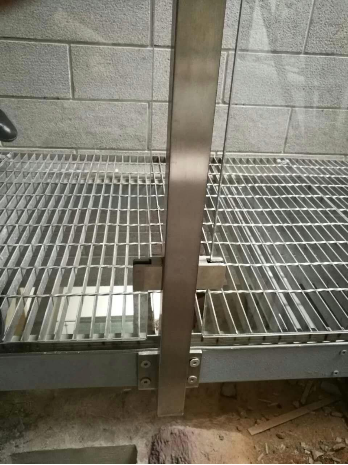
وظيفة درابزين مربعة لسور الحديدية