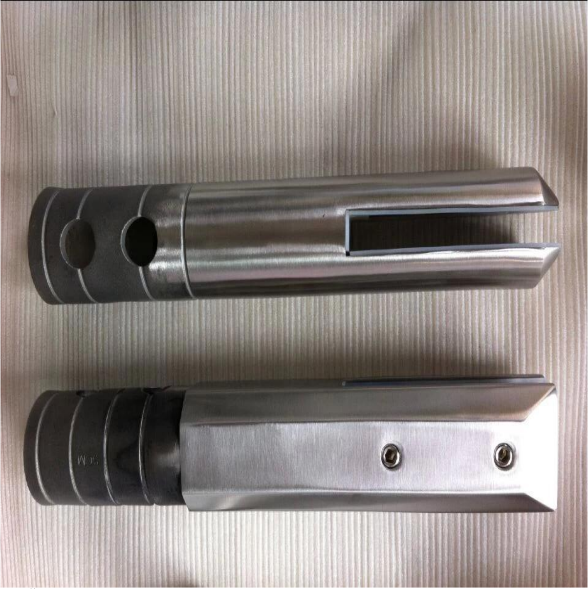
مع عصابة غطاء mini. آخر 3