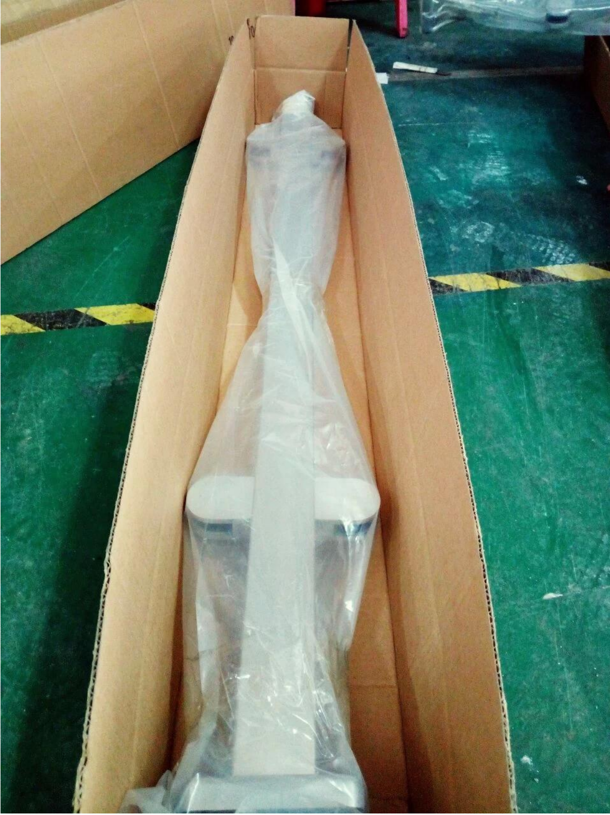
المشاريع. صور "منصة الدرج" فكرة الزجاج مربعة السور الفولاذ المقاوم للصدأ مع الدرايزين العلوي 4.