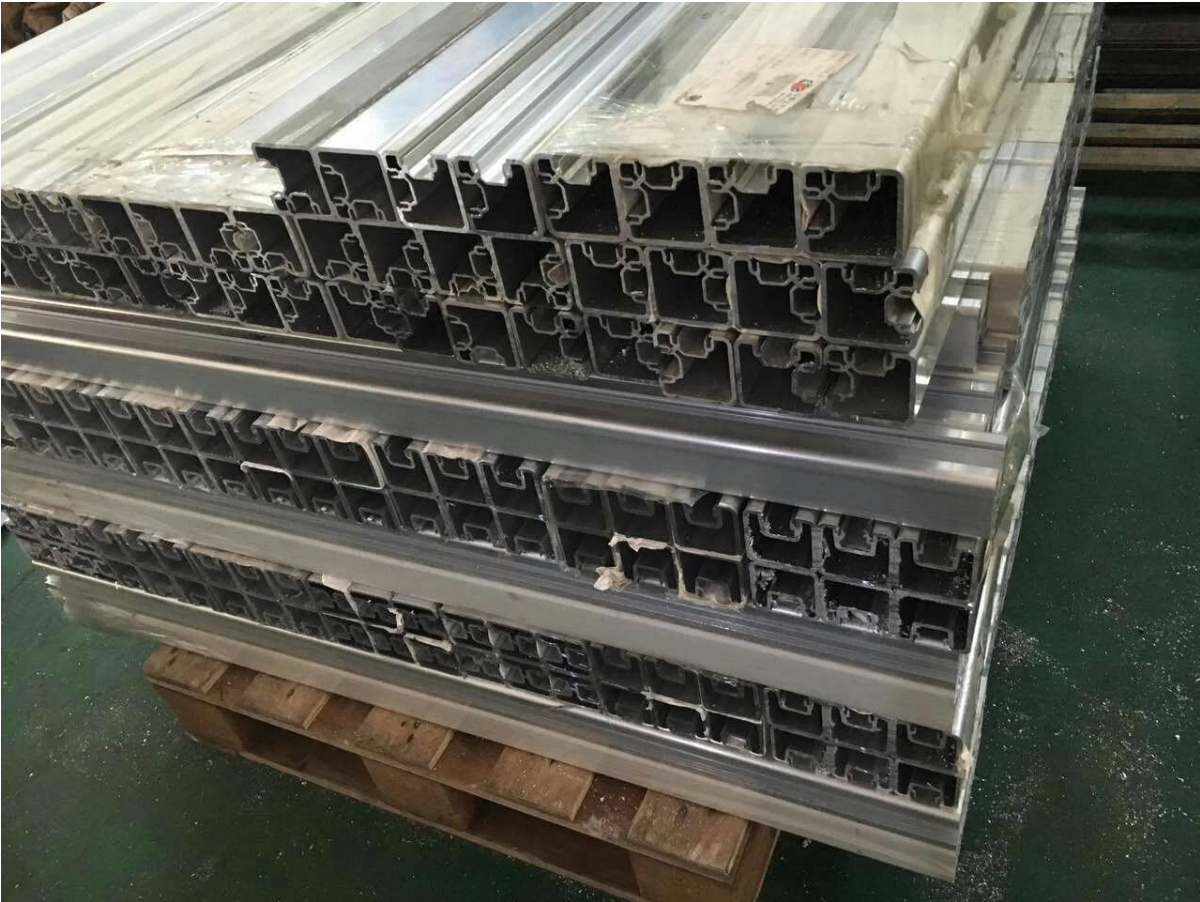
2) 50 قطر الجولة: 3mm خ 50mm