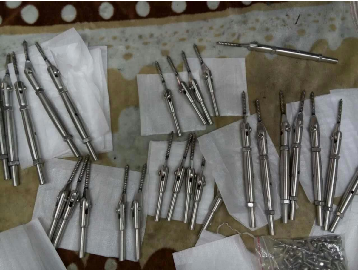
الفولاذ المقاوم للصدأ آخر كابل حديدي تصميم نوع