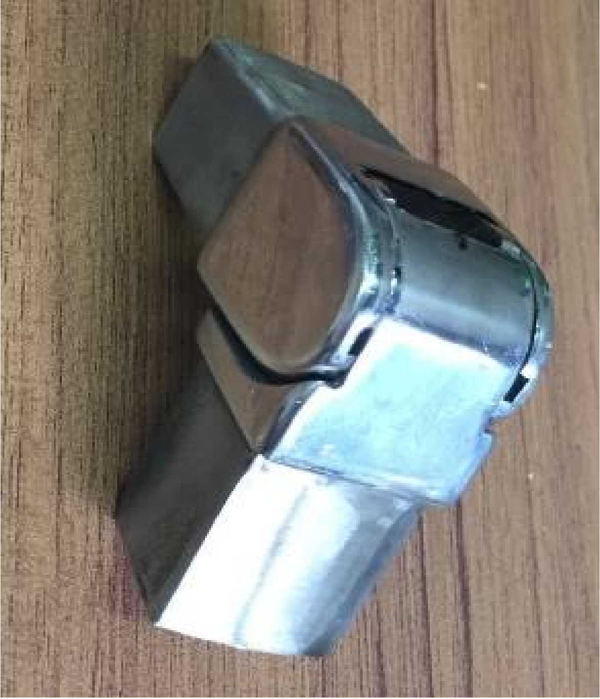
2).Left / بمين موصل قابل للتعديل.