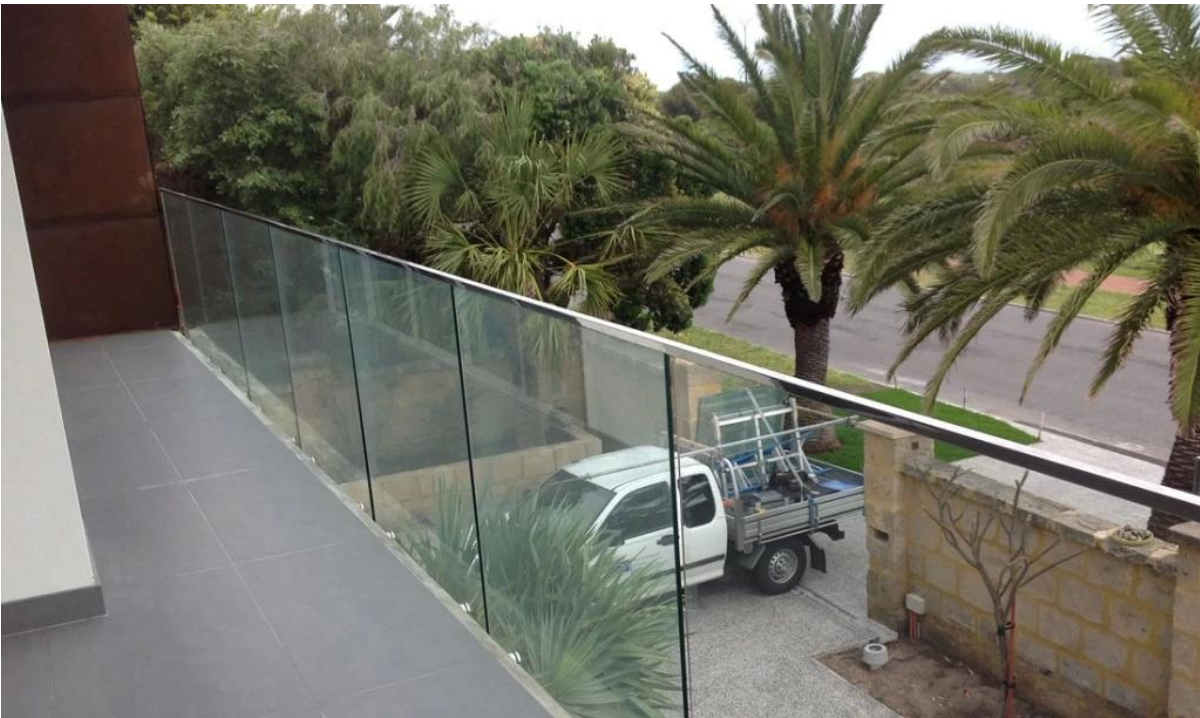
4. حنفية زجاج الزجاج بدون إطار تصميم حديدي .