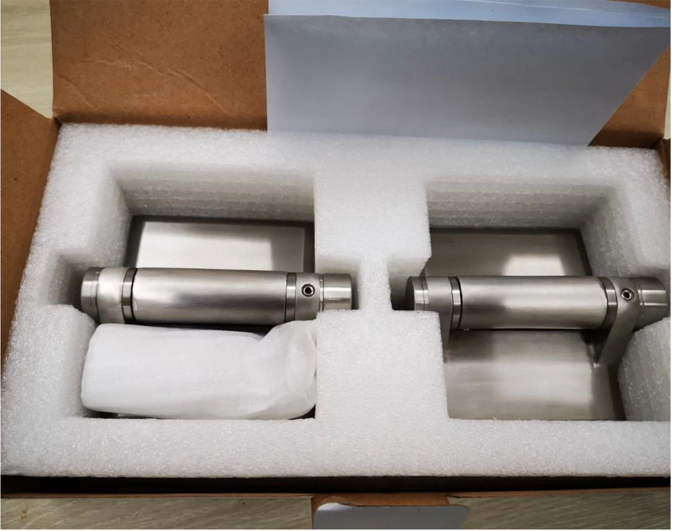
-غير القابل للصدأ والزجاج المفصلي الرسم