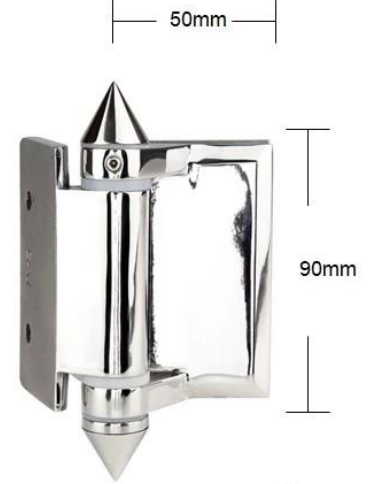
Part # G-W