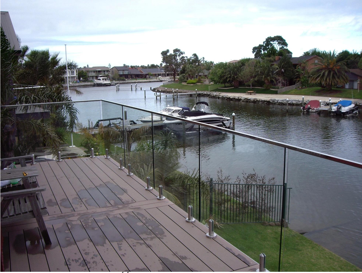
3): درايزين من الصلب المقاوم للصدأ أنبوب فتحة زجاج داخلي السور.