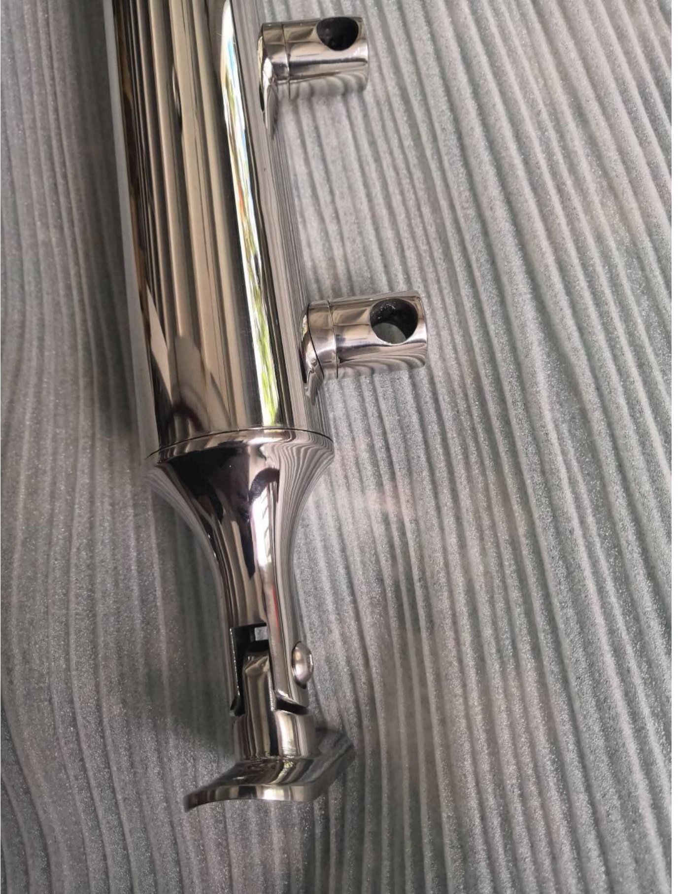
3). التعيئة من 316 الفولاذ المقاوم للصدأ حديدي العارضة بعد.