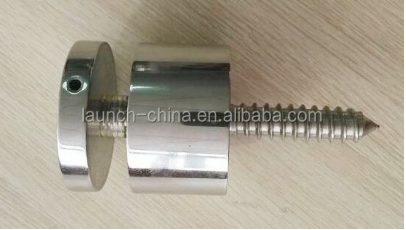
بين قوسين الدعم الزجاج SF-50 نموذج رقم 2.