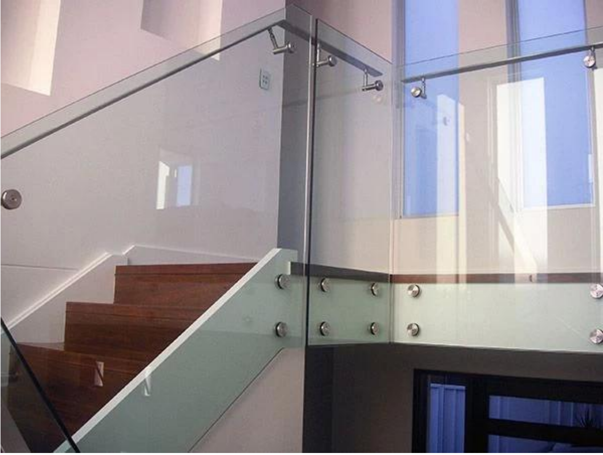
الصلب 316 المواجهة للجهاز الدعم الزجاج قوسين الزجاج قفل ممر داخلي تصميم الزجاج حديدي stainless. (3)