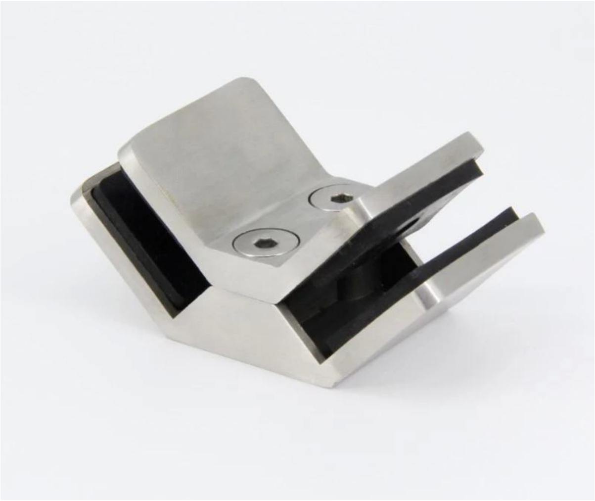
3D model of a mechanical part, oriented at 90 degrees.