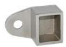
square top rail