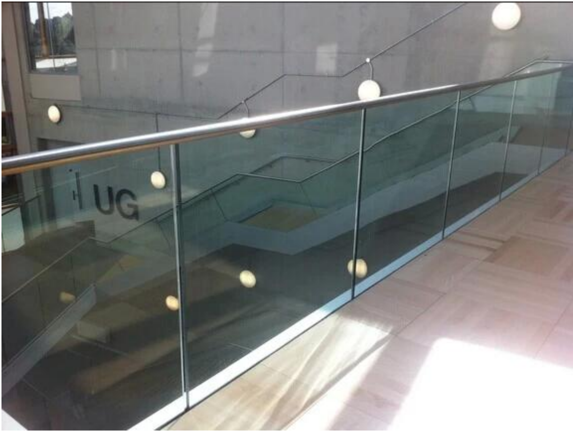
السكك الحديدية أعلى مربع المواد: الفولاذ المقاوم للصدأ 316 / 316