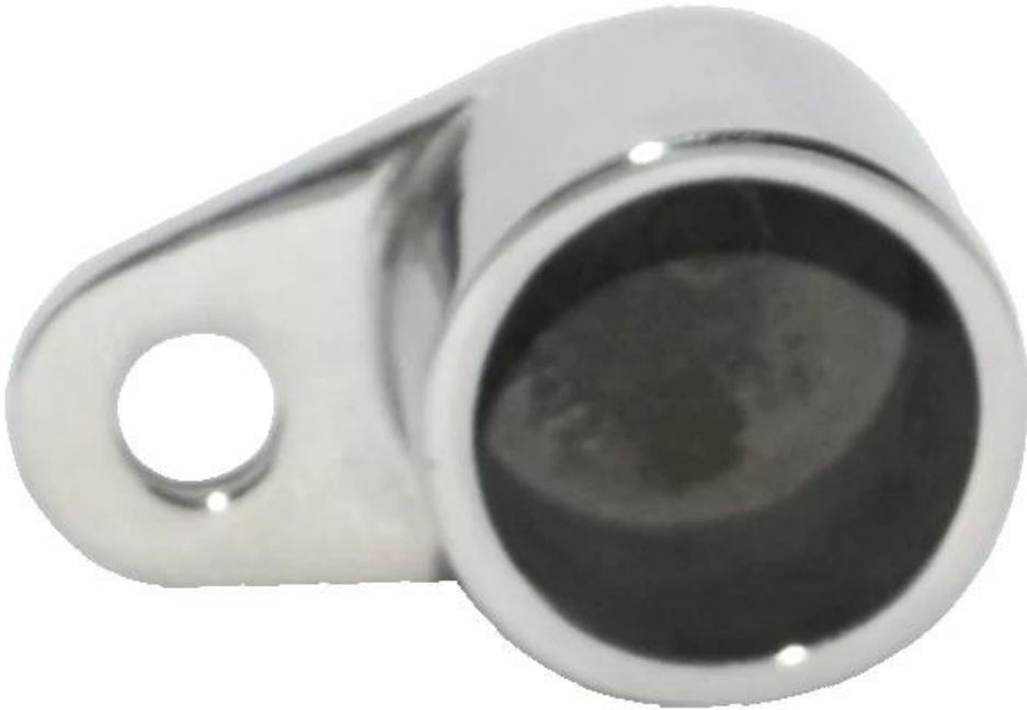
(4) نهاية سقف