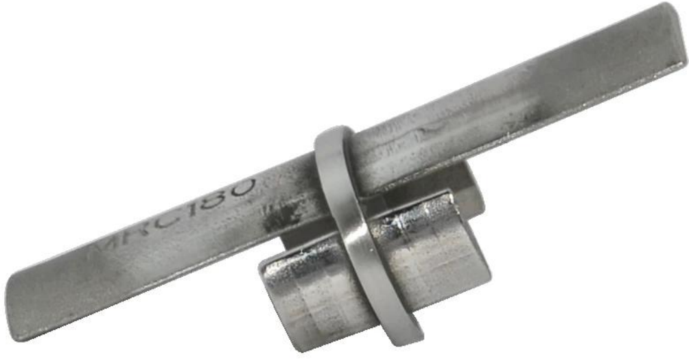
(3) الجدار للموصل السكك الحديدية