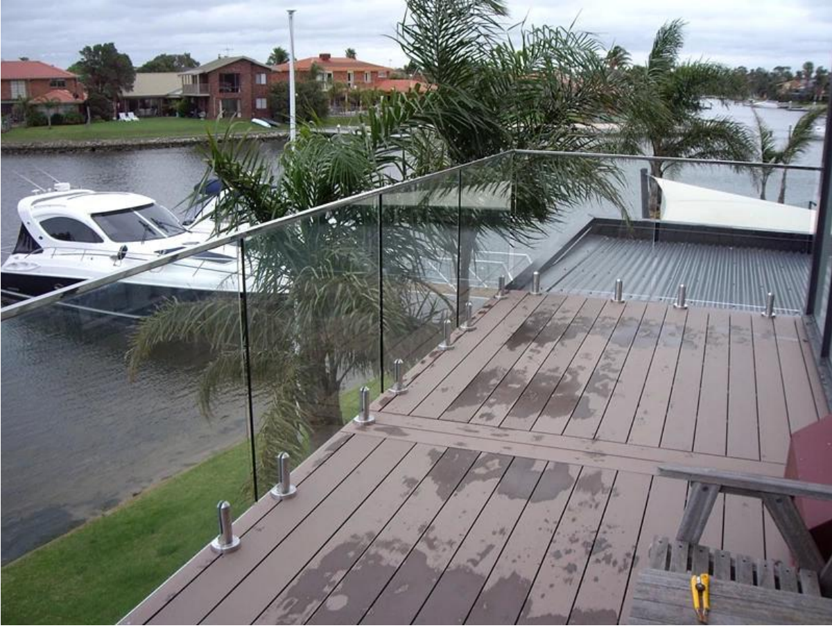
RBM-2: الزجاج حنفية