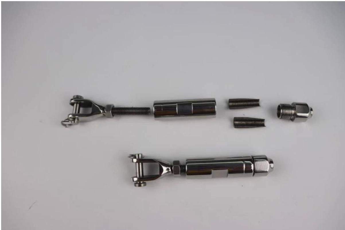
Kabelverschraubung T803 mit Schraubbefestigung in Holz