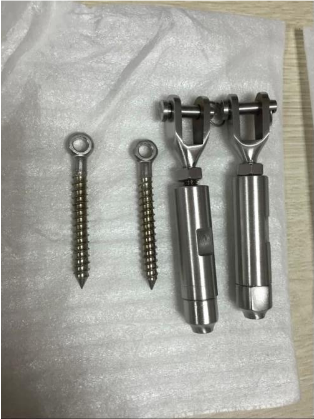
Kabelverschraubung T803 mit Bolzenbefestigung in Stahlpfosten.