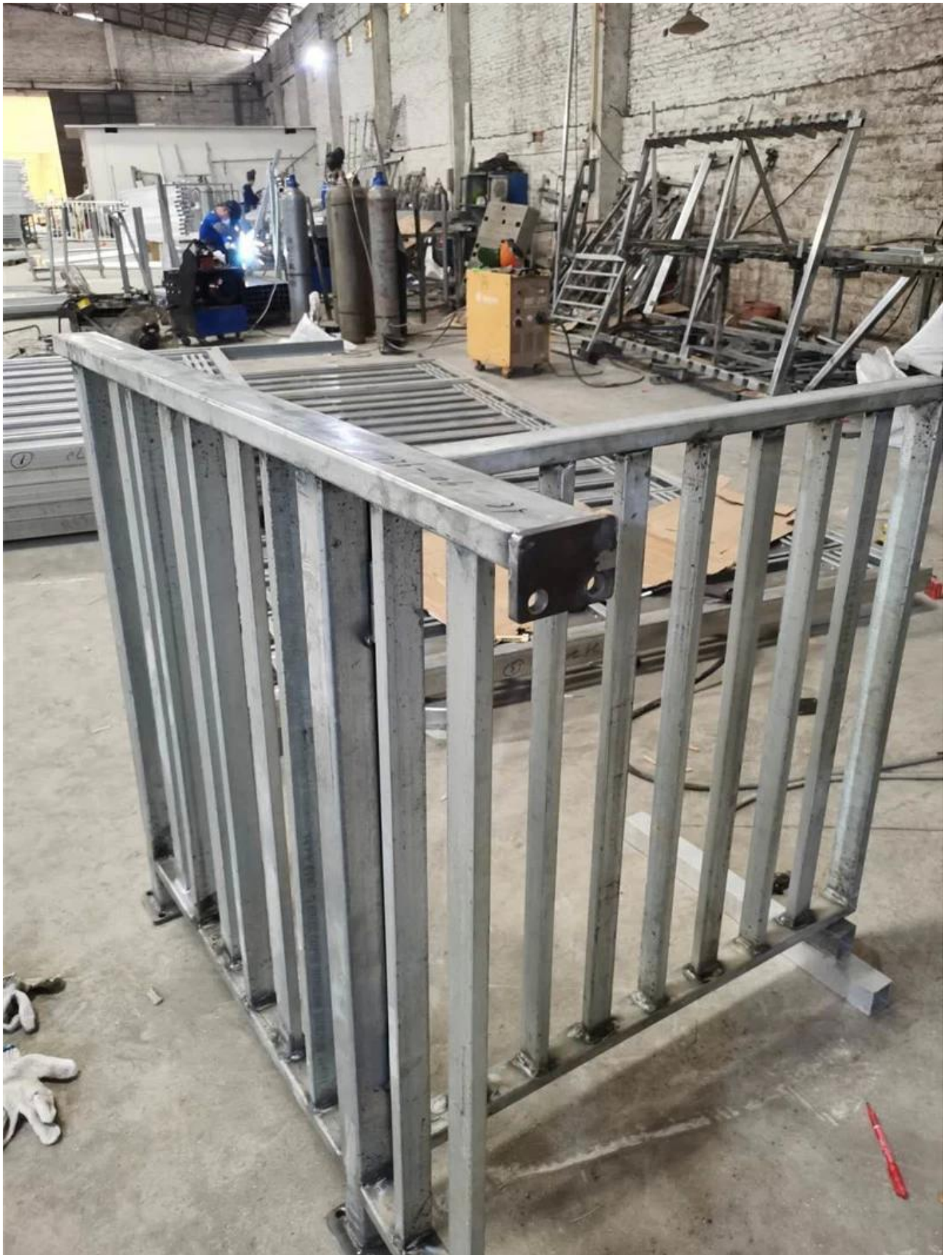
# Projektfotos von aLuminum Multi-Line-Rohrgeländer Designs-