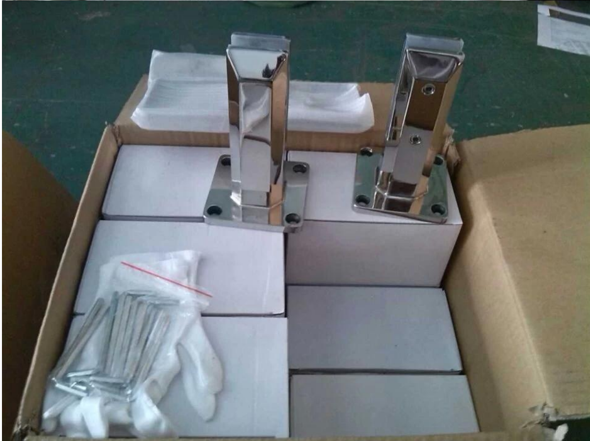
Fabrik & Zertifizierung