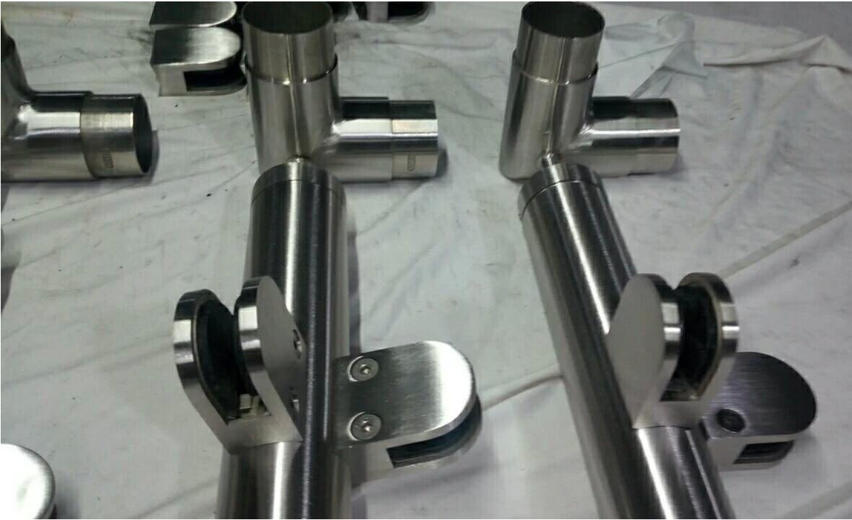
Glasbalustrade Handlaufpfosten mit Endkappe auf die Oberseite.