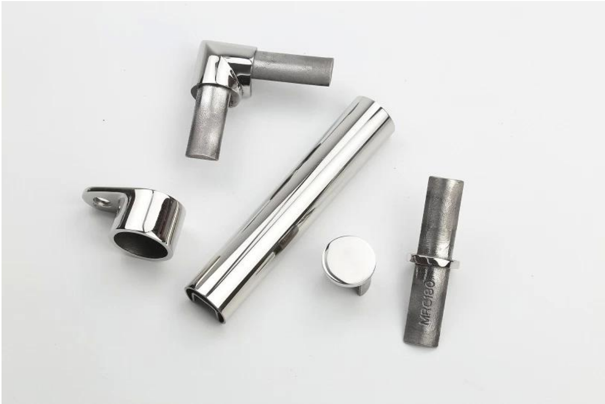
Projektfotos mit 21 * 25 * 1,2mm Kappenschienen-