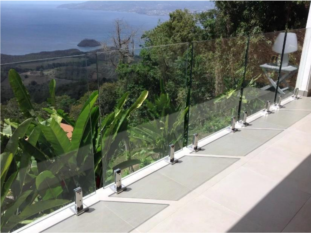
SBM in Spiegelfinish: