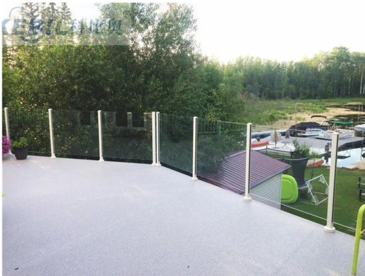
Aluminium-Glas-Geländer für Schwimmbad Zaun