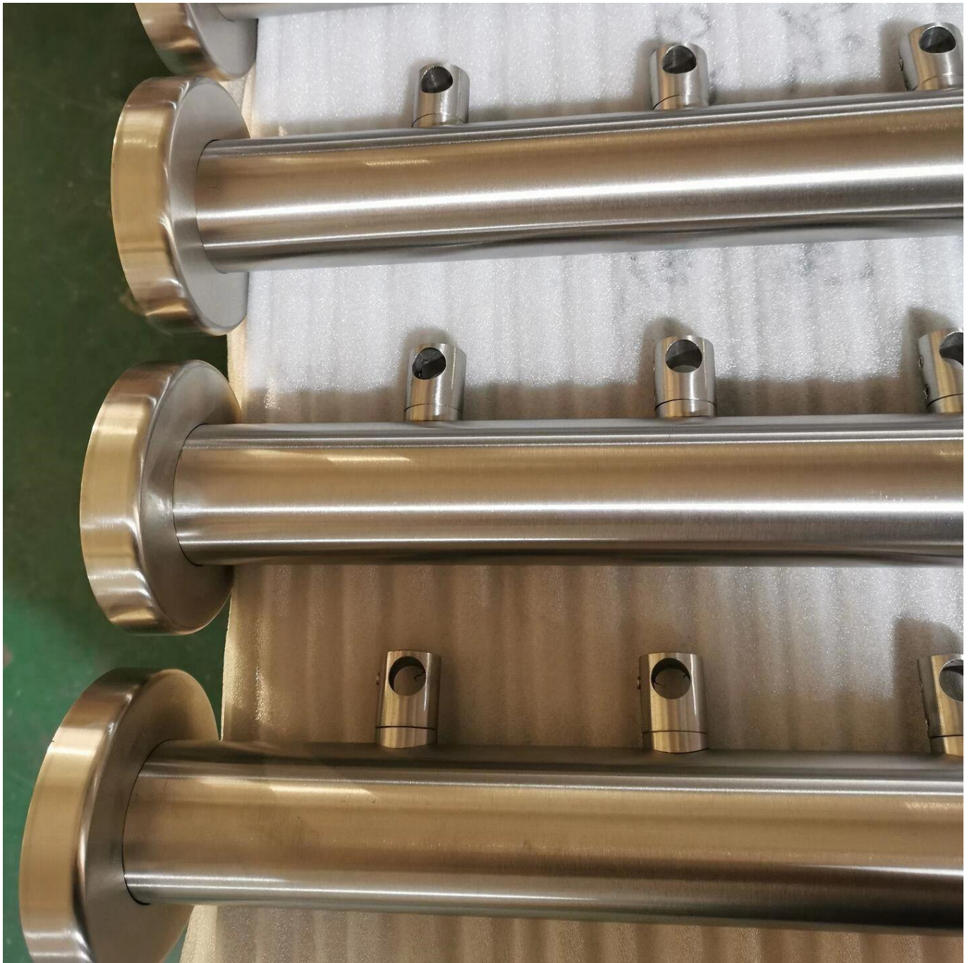
EndeDeckel & Gelenke für Kreuzriegel: