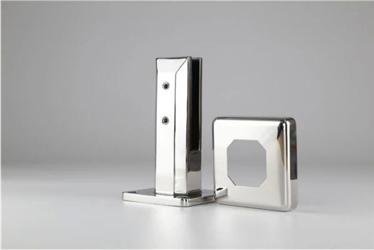
Glass Spigot in Spiegel poliert: