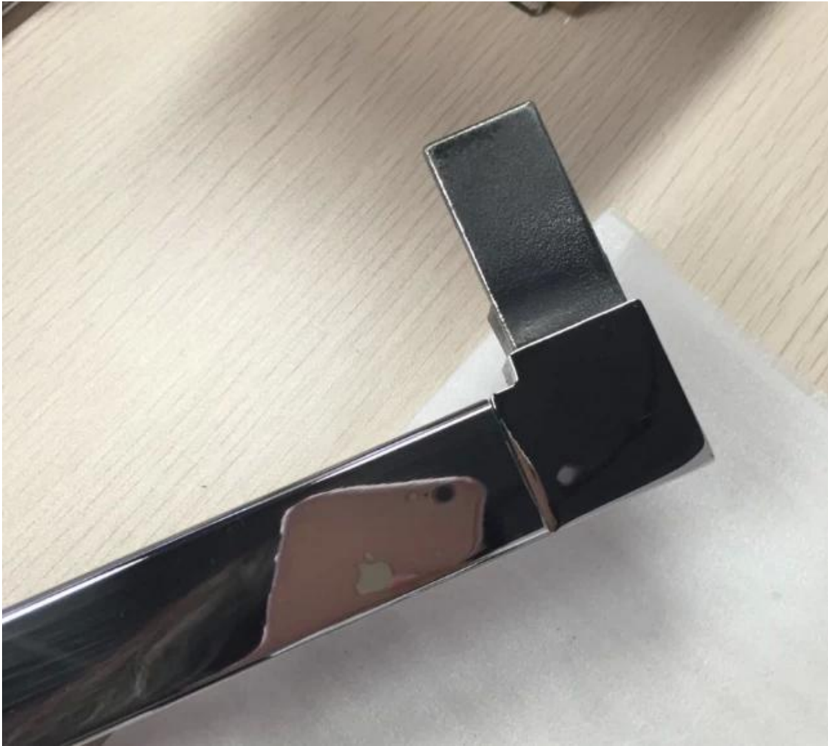
3. Glasgeländer Edelstahl Oberschienen Handlauf Armaturen Projekt: