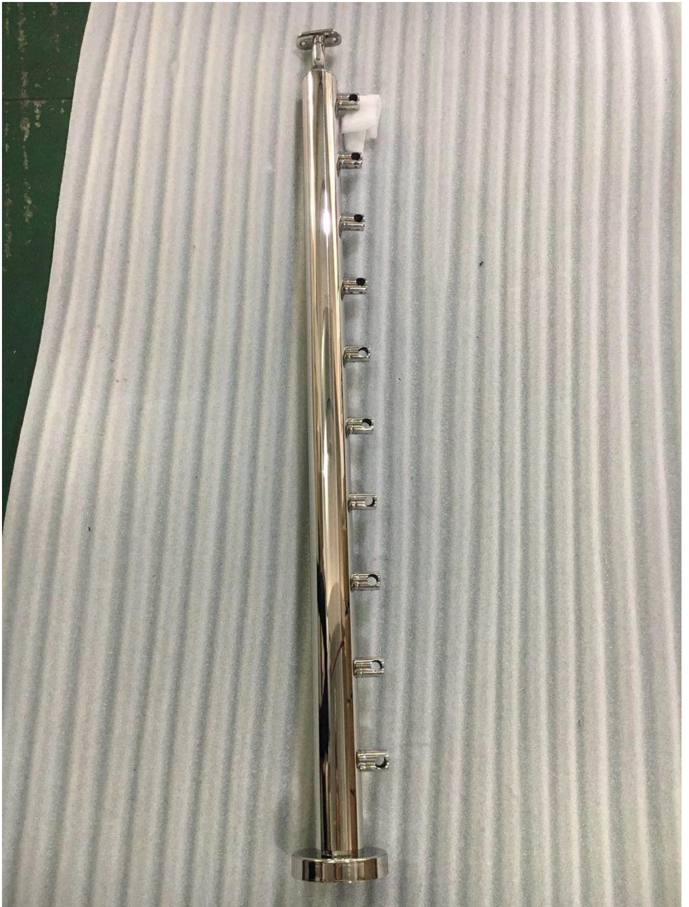
Geländerpfostenunterteil aus Edelstahl 316 (mit oder ohne geschweißtem Sockel) -