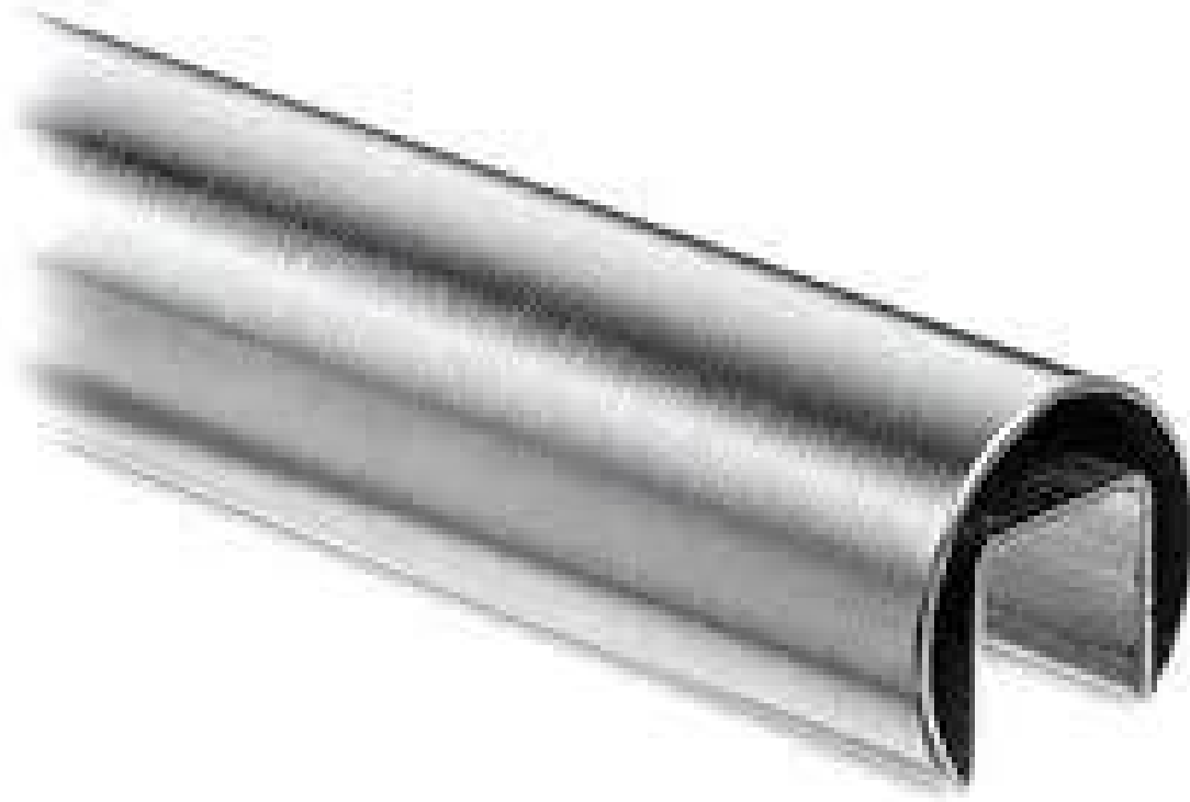
Runde Form Geländer aus Edelstahl für 1/2 " oder 3/8 " Glasgeländer Foto,