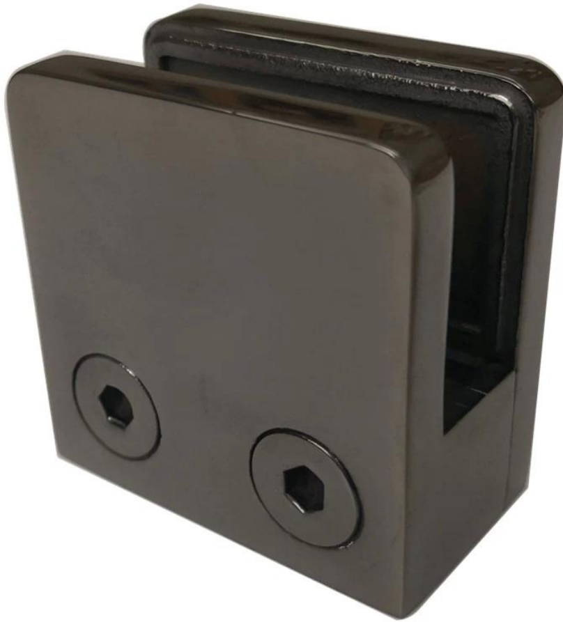
weiße Farbe D Typ Edelstahl Glasklemmen-