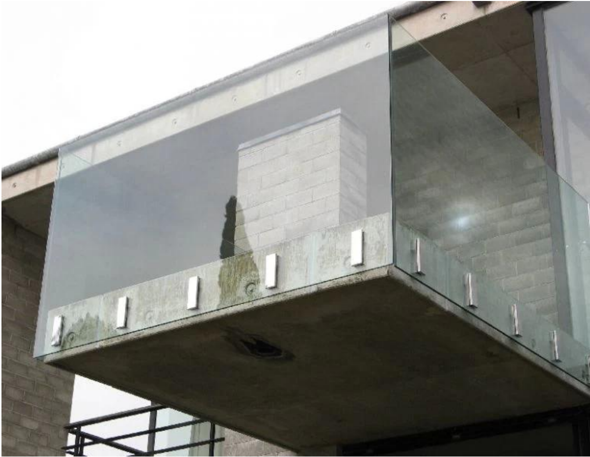
Andere Modelle von Glaszapfen erhältlich - quadratischer Glaszapfen der Grundplatte