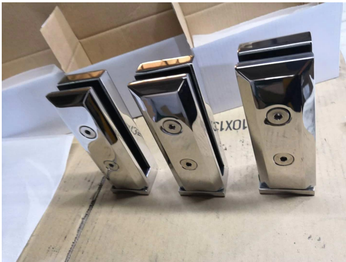
2) Tamaño de la espita de vidrio de montaje lateral