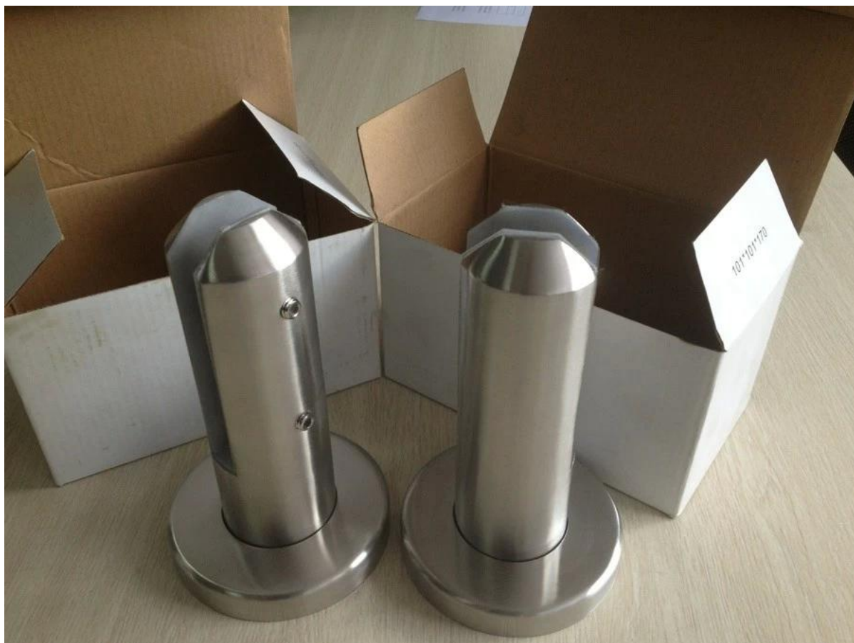
Pic 5.project para el balcón balastrada