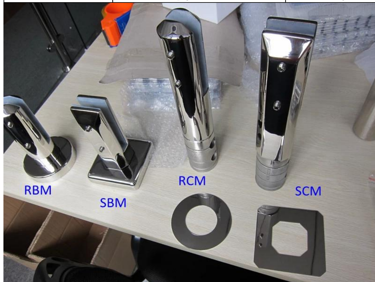
Fotografías en primer plano