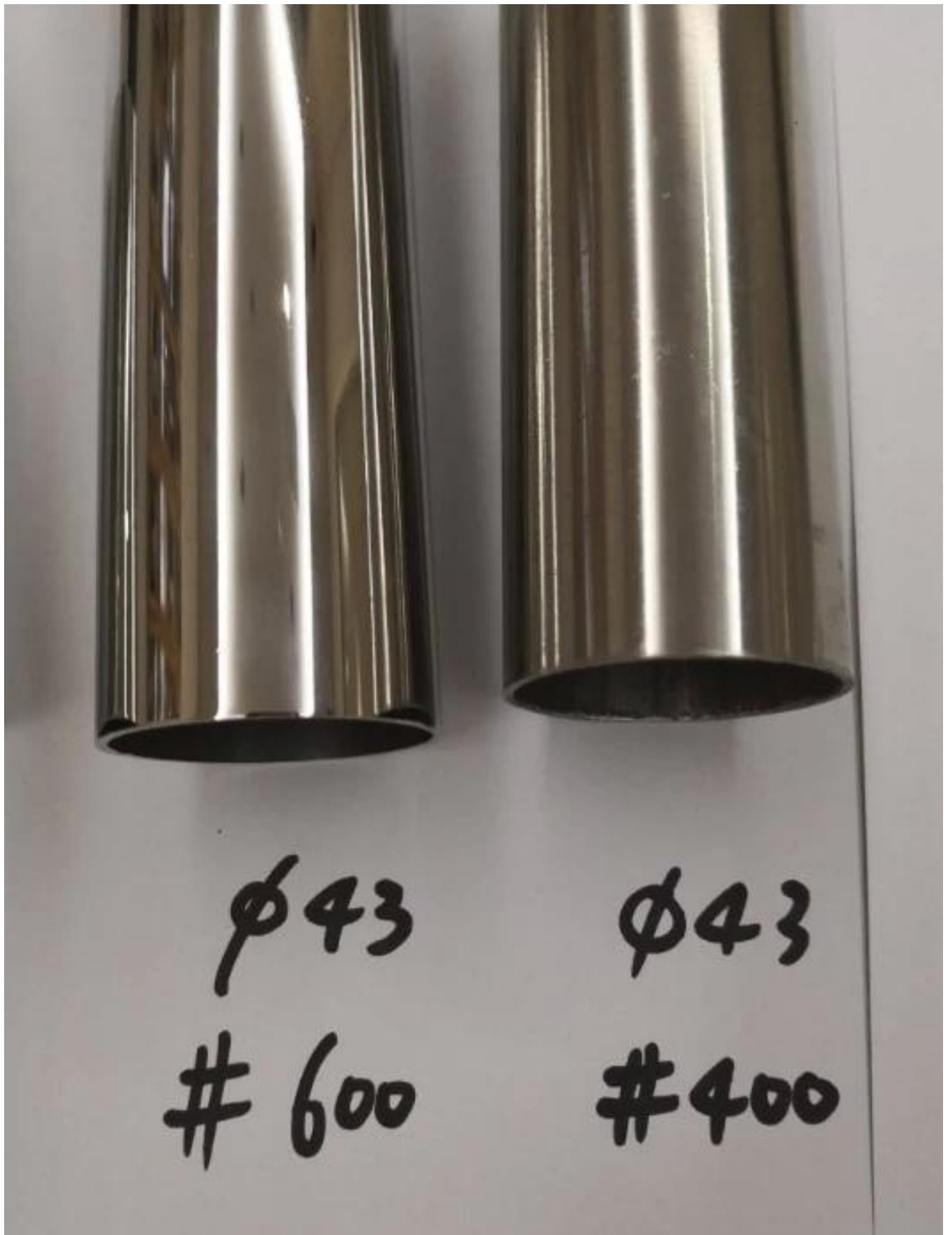
Fotos de producción para pasamanos de acero inoxidable