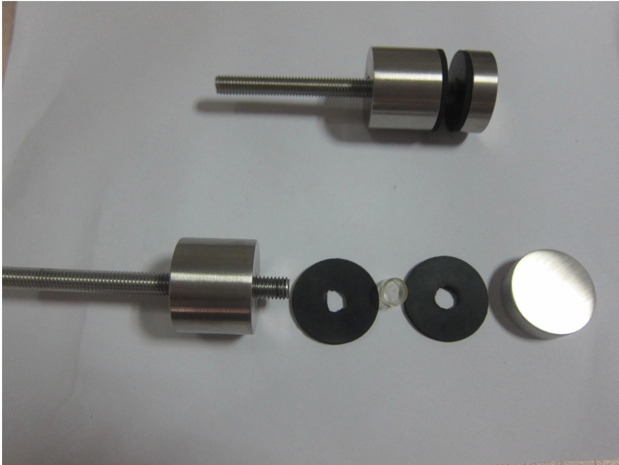
(3) Separador de vidrio de diferentes tamaños disponible