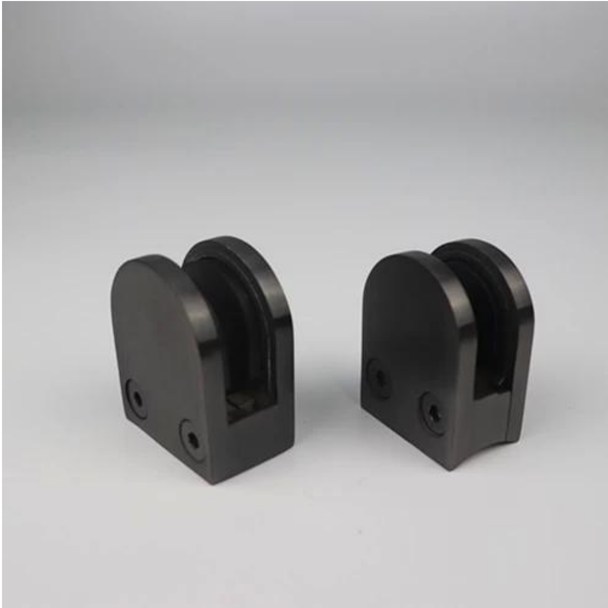
Abrazadera de vidrio con aspecto de madera de nuevo diseño