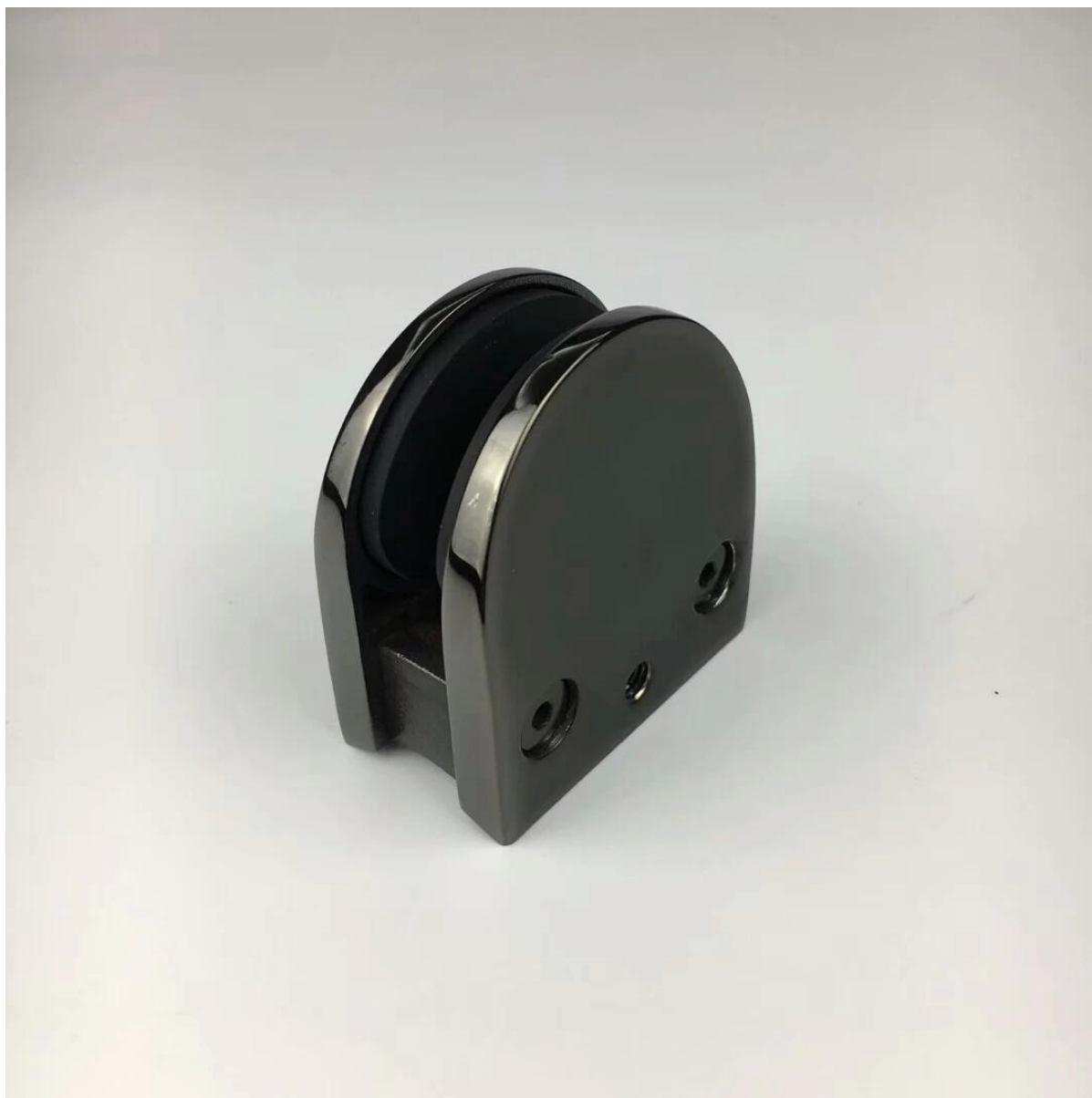
Abrazadera de vidrio con acabado negro galvanizado - acabado mate