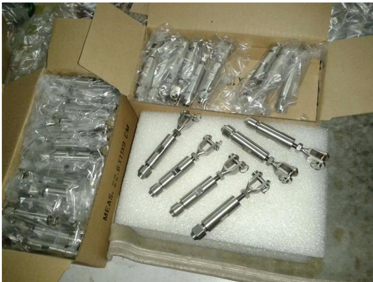
Fotos de proyecto de barandilla de cable