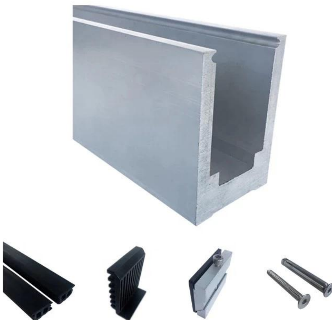
Fotos de embalaje de la base de aluminio del zapato del canal U -