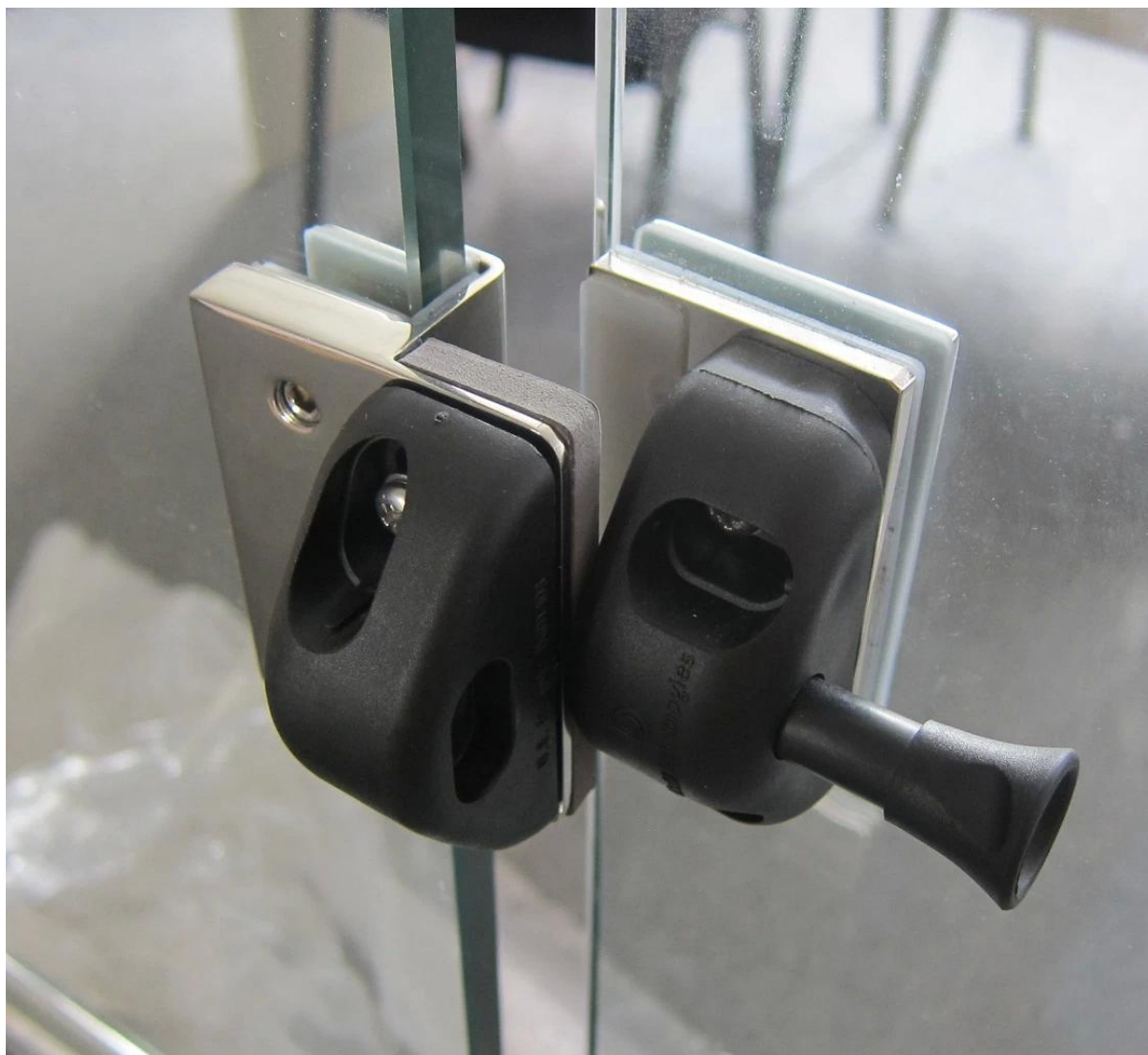
bisagra de cristal