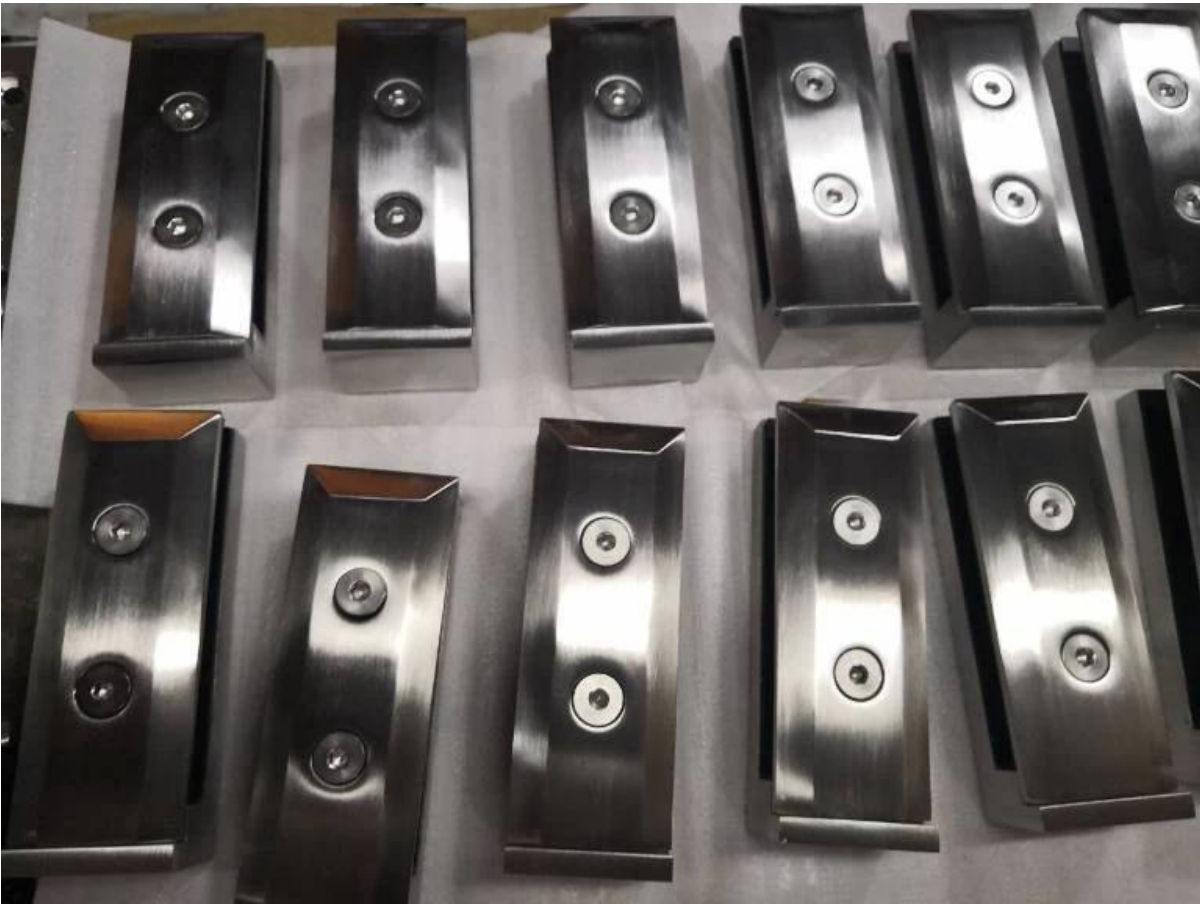
Fotos del proyecto de fascia montaje vidrio espita -