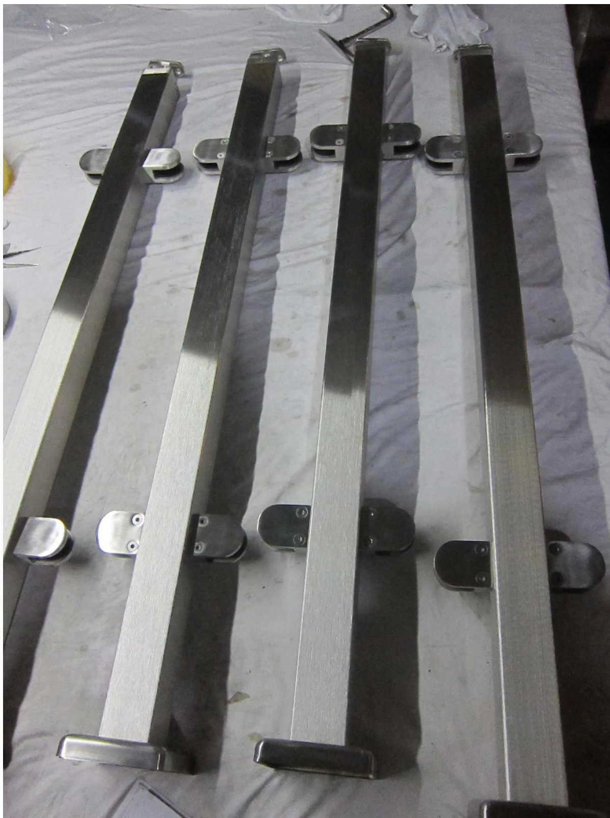
Fotos de la instalación de barandas de cristal del hotel SOLO SUITE -