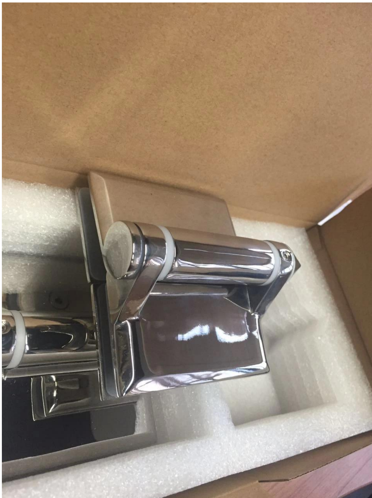
Lasin saranoiden projektikuvat