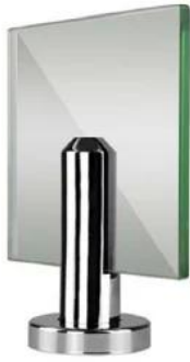
Round base plate spigot , model# RBM-2