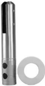
Round core drill glass spigot , model # RCM-2