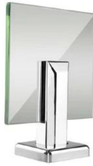
Square base plate spigot , model# SBM-2