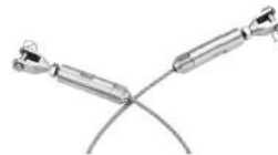
T803- 3mm/4mm/5mm cable